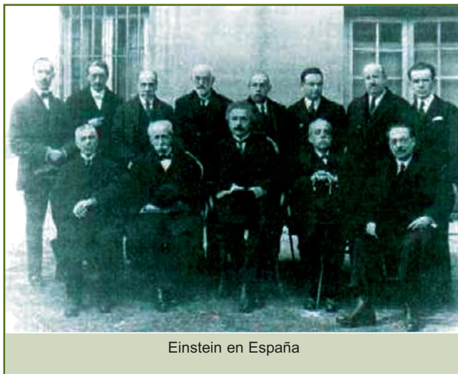
Einstein en España

llamó Energiequanten y Lichtquanten a esas unidades elementales de energía. La idea del fotón como corpúsculo luminoso es posterior; la introdujo en 1916, y quedó definitivamente establecida tras las experiencias de Compton en 1923, que pusieron de manifiesto la consistencia de la relatividad especial con la idea de un corpúsculo luminoso (el nombre, fotón, fue introducido por Gilbert Newton Lewis en 1926).