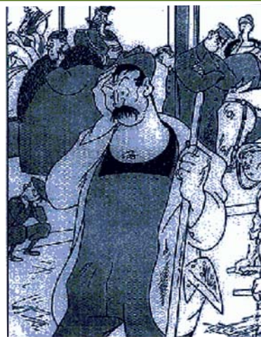
Figura 1. La gente se acostumbró poco a poco a la idea de que la geometría del espacio era la realidad física última (Profesor A. Einstein)

Así pues, Einstein establece en 1907 el principio de equivalencia entre la gravitación y la inercia. Einstein completó la teoría general de la relatividad con su artículo de 1916. Ese año, satisfecho tras su monumental trabajo, escribió a Pauli: a partir de ahora, “durante el resto de mi vida, quiero reflexionar sobre qué es la luz” (en una carta escrita pocos años antes de su muerte afirmó: “si alguien te dice que entiende lo que significa E = hv , dile que es un mentiroso”). Es posible que, de no haber existido Einstein, no hubiera sido necesario esperar mucho para que alguien desarrollara la teoría especial de la relatividad; como hemos visto, los ingredientes esenciales estaban ya disponibles en 1905. Sin embargo, sólo el genio de Einstein pudo establecer en aquella época la teoría general, cuya validez esencial se mantiene en nuestros días. En efecto, aunque se han propuesto algunas modifica-